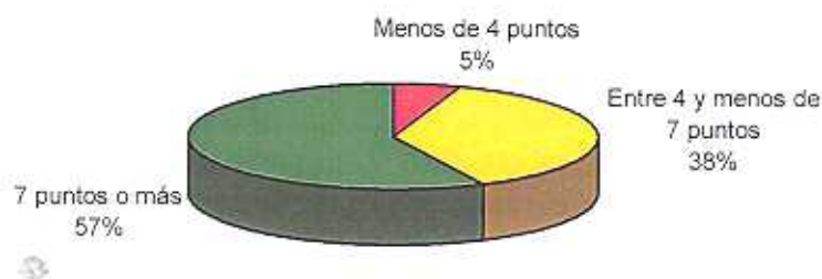
Gráfico N° 3. Prueba de Ciencias Naturales - 7mo Grado 1999 Distribución de los alumnos según puntaje obtenido

Cantidad de alumnos a los que se les suministró la prueba: 1.527