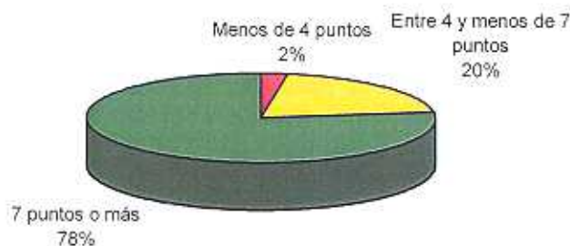
Gráfico N° 4. Prueba de Ciencias Sociales - 7mo Grado - 1999 Distribución de los alumnos según puntaje obtenido