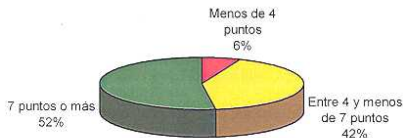
Gráfico N° 2. Prueba de Lengua - 7mo Grado - 1999 Distribución de los alumnos según puntaje obtenido